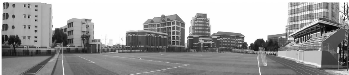
南洋中学新老校园全景图