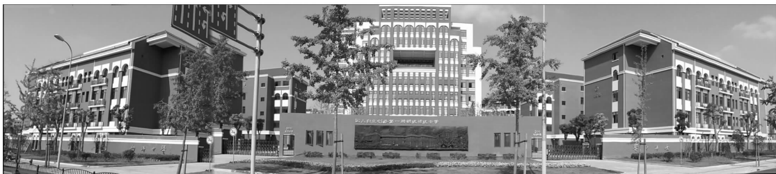
上海市南洋中学大门(龙华中路200号)